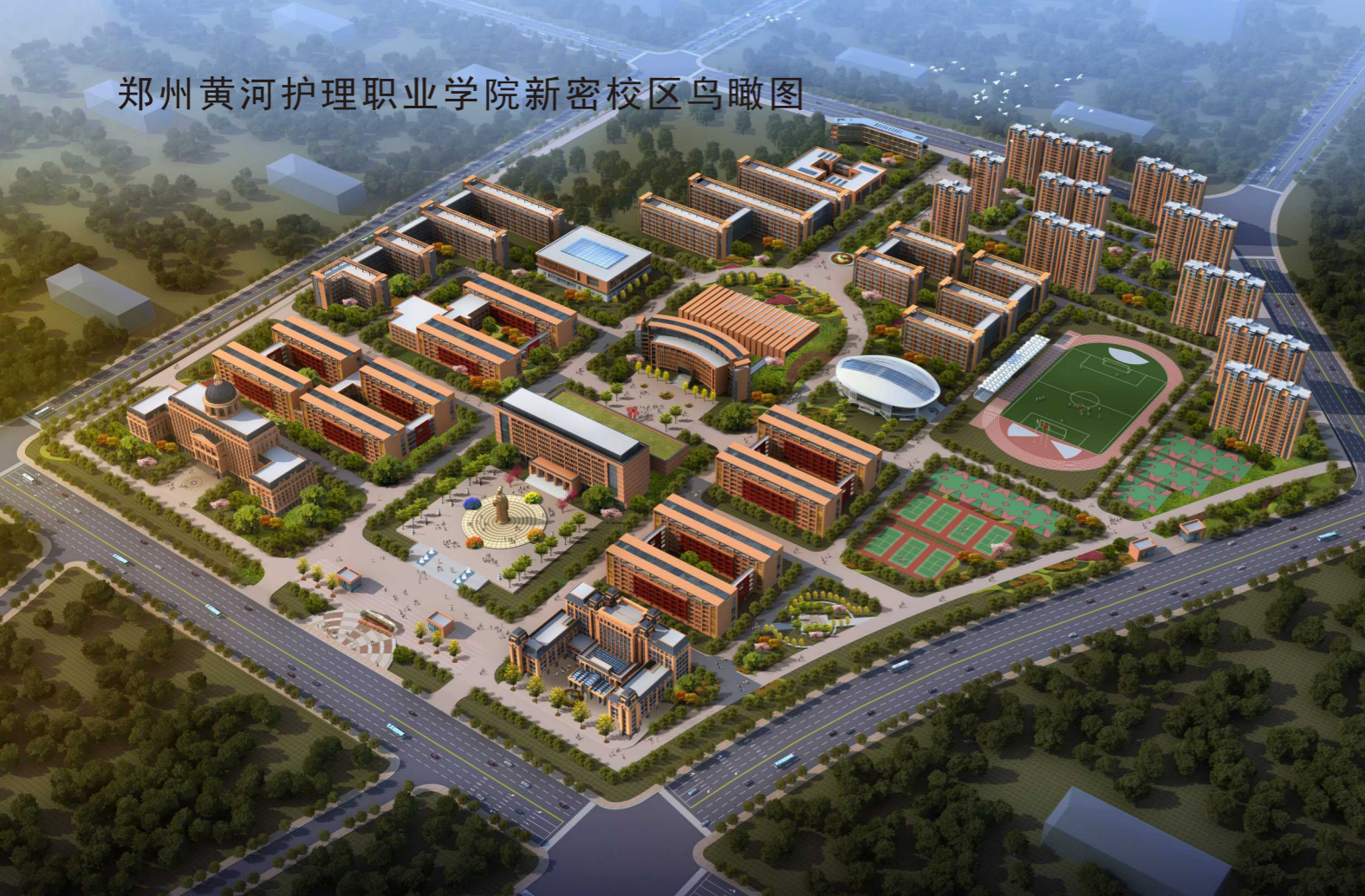
郑州黄河护理职业学院新密校区鸟瞰图