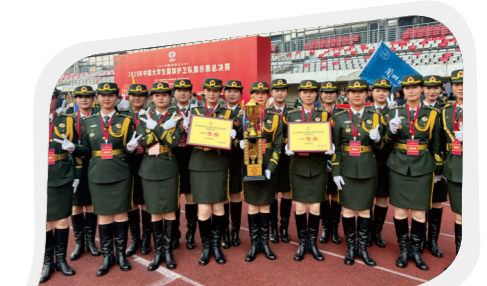
我校在中国大学生国旗护卫队展示赛总决赛获三冠佳绩