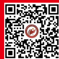
学校官方微信公众号