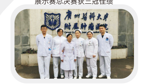
就职广州医科大学附属肿瘤医院