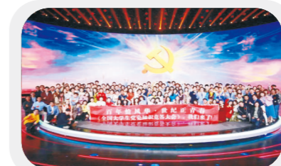
参加全国大学生(CCTV)党史问答大会