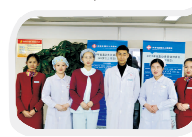
就职河南省直第三人民医院