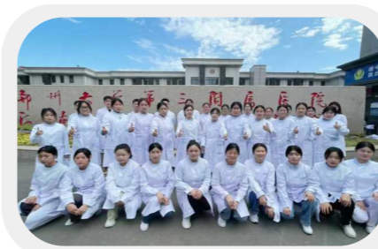
郑州大学三附院实习就业