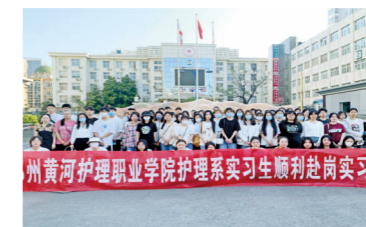
郑州市第一人民医院实习