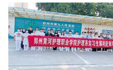
郑州市第九人民医院实习