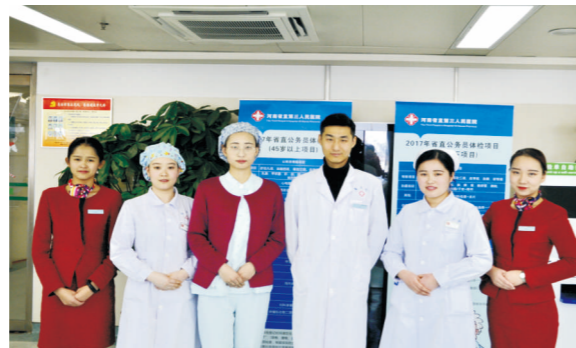
就职于河南省直第三人民医院