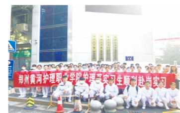
郑州大学第二附属医院实习