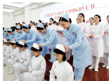
学生参加5.12护士节授帽仪式