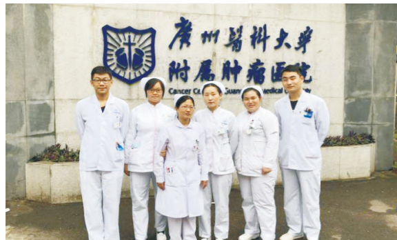
就职于广州医科大学附属肿瘤医院