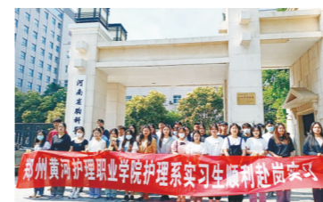
河南省胸科医院实习