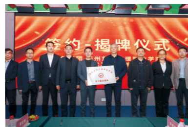
与中创科技集团携手共建实习就业基地