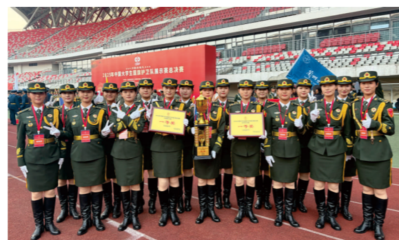
学生参加中国大学生国旗护卫队展示赛荣获三冠佳绩