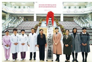
新密市妇幼保健院教学实践基地揭牌仪式

学校始终坚持社会主义办学方向，牢记为党育人、为国育才的初心使命，落实立德树人根本任务，秉承“以人为本、仁者爱人、止于至善”的办学理念，落实国家职业教育政策精神，不断深化产教融合，加强校企合作、医教协同、人才共育。积极拓展高质量校外实习及就业基地，已与省内外100多家医院及企业签订了实习就业合作协议。推进“校院循环，合作育人”“订单培养”人才培养模式，构建具有产学研一体化的特色教学运行机制，在工作岗位上培养学生的职业道德、职业素养和就业创业能力，实现学生、学校、院企三方共赢，促进毕业生高质量充分就业。