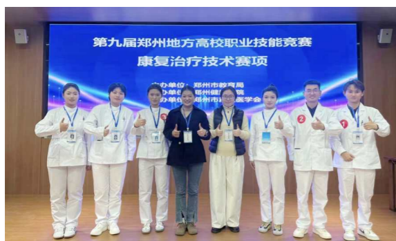
学生参加郑州地方高校职业技能竞赛“康复治疗技术赛项”荣获团体二等奖