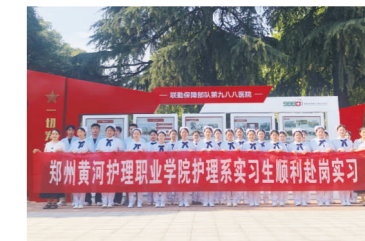
中国人民解放军联勤保障部队 九八八医院实习