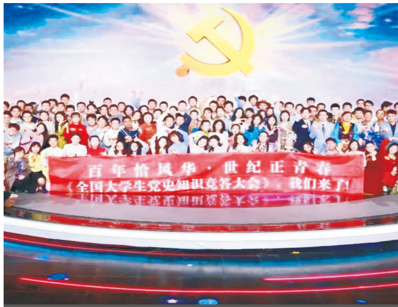
学生参加全国大学生(CCTV)党史问答大会荣获团体二等奖