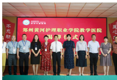
郑州中康医院教学实践基地揭牌仪式