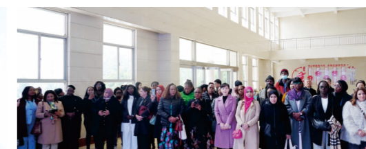
非洲女性议员研讨班一行参访我校