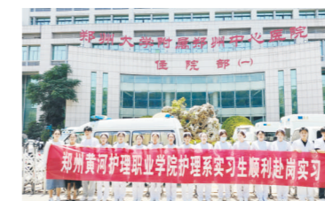
郑州大学附属郑州中心医院实习