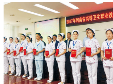
学生参加护理技能大赛荣获优秀组织奖