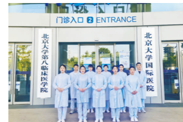
北京大学国际医院实习