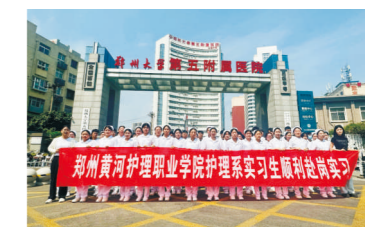
郑州大学第五附属医院实习