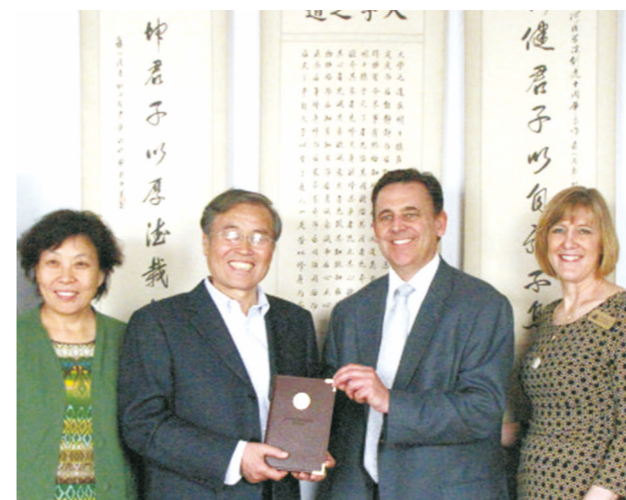
与美国荷晶大学洽谈合作