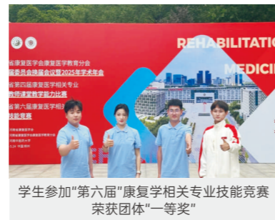
学生参加“第六届”康复学相关专业技能竞赛荣获团体“一等奖”