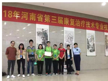
学生参加河南省康复技能竞赛荣获团体二等奖