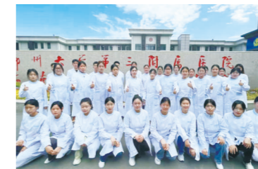
郑州大学第三附属医院实习